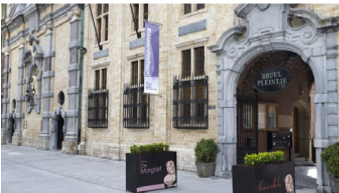
De Koninklijke Beiaardschool Jef Denijn in Mechelen.