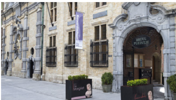
De Koninklijke Beiaardschool Jef Denijn in Mechelen.

De klokkengieters konden geen goede beiaarden meer gieten. Ze waren allemaal vals. Niemand wist meer hoe je klokken moest stemmen. De mensen waren ook niet meer geïnteresseerd in muziek uit torens: ze gingen liever naar een concertzaal, waar ze lekker binnen konden zitten en muziek horen waar ze zelf voor gekozen hadden. Veel mensen vonden de beiaard maar 'volks' en de muziek niet meer interessant.