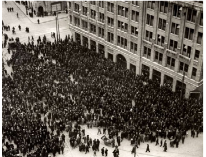
De mensenmassa op de Dam.

Bij de geboorte op 30 april 1909 van prinses Juliana, de grootmoeder van Koning Willem-Alexander, speelde hij een concert. Hiermee trok hij duizend mensen naar de Dam om te luisteren en de geboorte te vieren. Dat smaakte naar meer en hij ging concerten geven op Kerstavond en met Pasen. Ook speelde hij regelmatig samen met harmonieorkesten, koperblazers en kinderkoren.